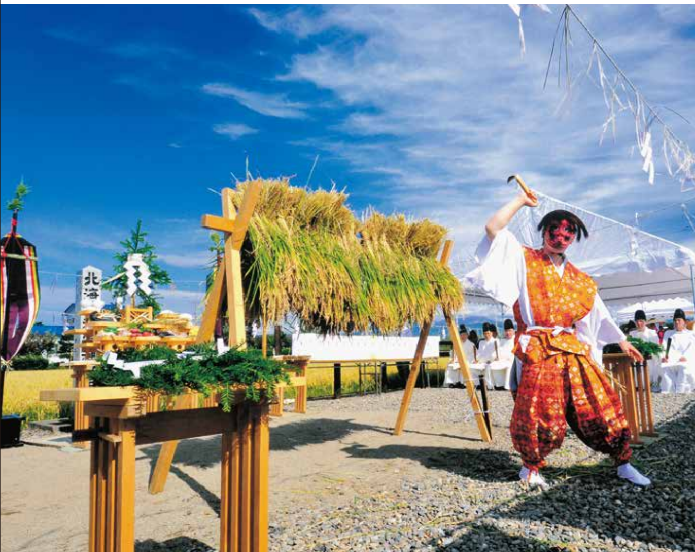
第3回北海道神宮フォトコンテスト入賞作品(貝沼正雄)