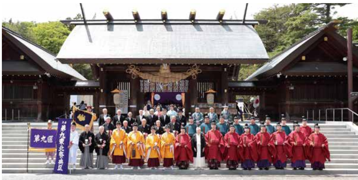
年番第九東北祭典区