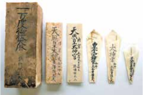
御祓大麻(神宮司庁)

御師は神宮の尊さを全国に伝え、また人々の祈願に応じた祈禱を行いました。その祈禱(御祓)を凝らした神札は御祓大麻と呼ばれ、人々はそのを通して日常身近に伊勢の神宮の神徳を仰ぎました。御師は平安末期から鎌倉初期に誕生したと言われていますが、江戸時代後期には全国の約九割にも及ぶ家々に御祓大麻が祭られるほどになっていました。