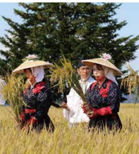
稲を刈る早乙女達