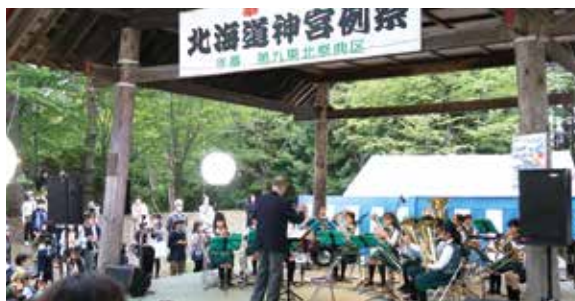
宮の森小学校スクールバンド(奉納行事)