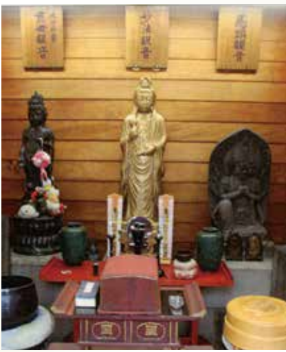
大岡助右衛門が晩年住んだ経王寺の観音堂