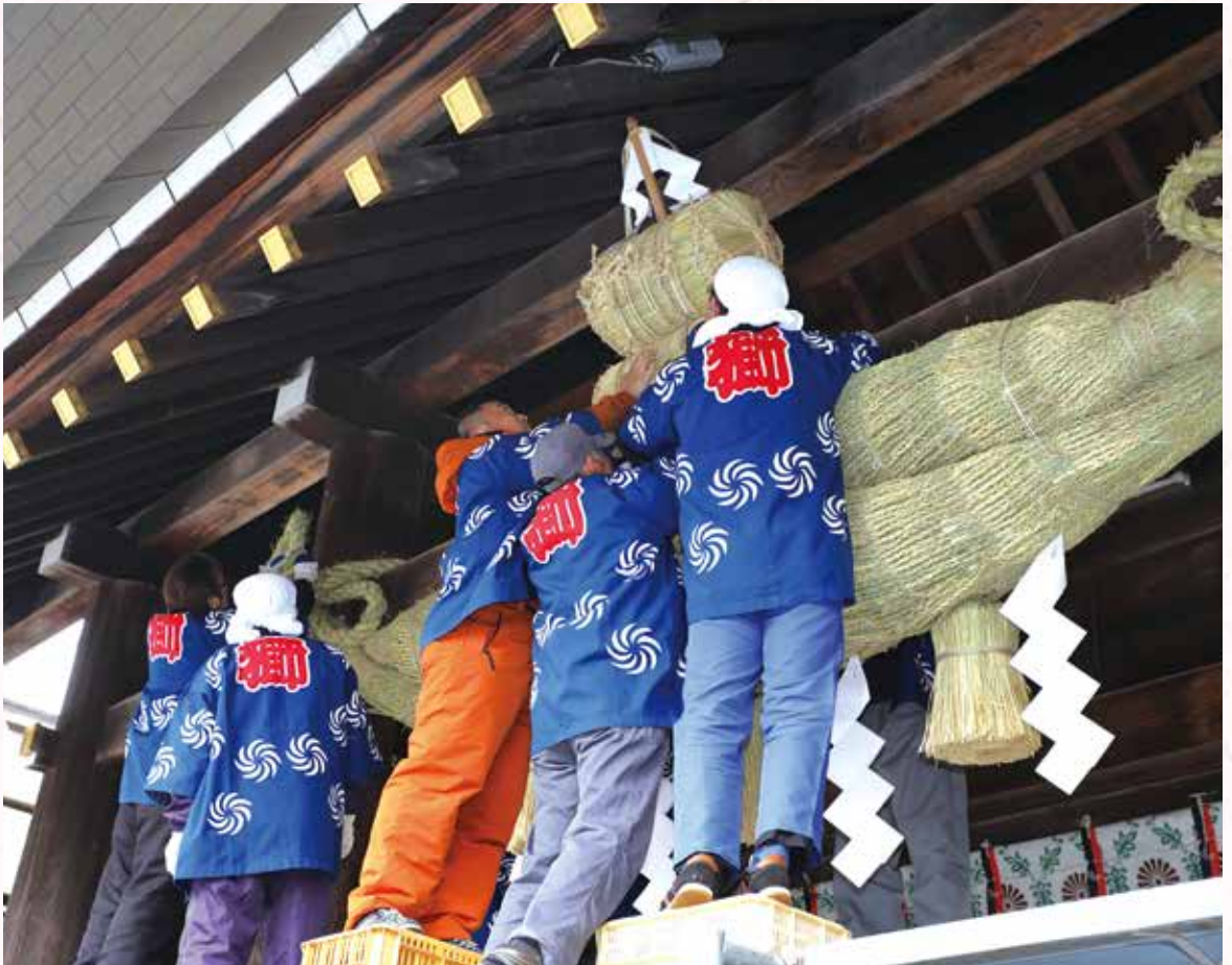
中富良野俵神輿同志会 大注連縄奉納