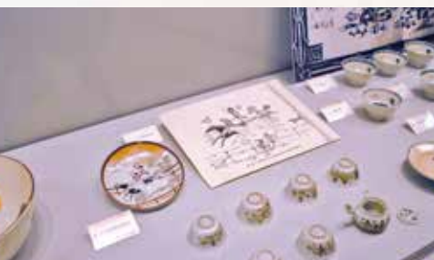
北海道神宮収蔵品「アイヌ曲馬図版画」