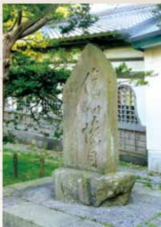
「傷心惨目」の碑＝高龍寺境内(函館)