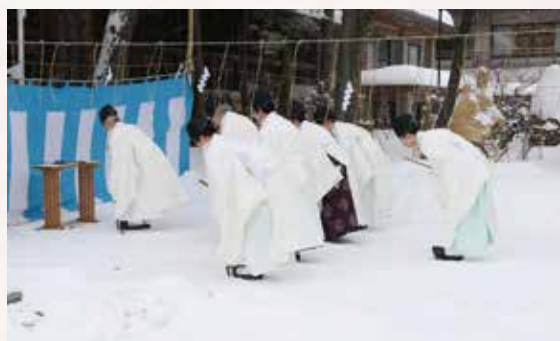
昭和天皇祭遙拝(1月7日)