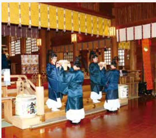
海の幸・山の幸を供する

祈年祭とは「としこいのまつり」と訓みます。ここでいう「年(とし)」とは稲の意味で、稲は勿論、様々な農作物や海の幸、山の幸などの豊作・豊漁を祈る大切なお祭りの一つとされています。北海道神宮でも二月十七日(日)午前十時に斎行し、祝詞奏上、巫女による「迦陵頻」の奉奏、玉串を奉り拝礼を行い豊かな実りを祈念しました。