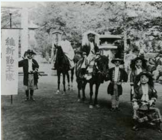
維新勤王隊隊長及び司令

大正十五年従来の祭典区組織を発展的に解消して札幌敬神講社が設立され、例祭の神輿の渡御をはじめ神社の維持に奉賛する崇敬者団体となりました。また、同年円山村に円山敬神講社が設立されました。この年の年番は第一区であったことからこれを記念して、京都の平安神宮の時代祭の維新勤王隊を移すこととなり、京都より楽士を招き楽士隊を養成し、各祭典区から兵士の役を割り当て、神輿渡御のさきがけとなりました。